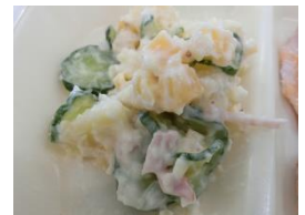
矢越かぶのポテトサラダ